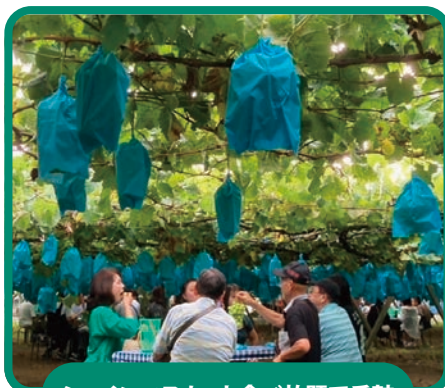
シャインマスカット食べ放題で舌鼓