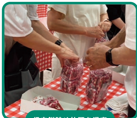
信玄餅詰め放題を満喫